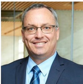
Coprésident du Conseil d'administration