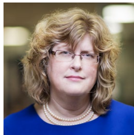
Coprésidente du Conseil d'administration

Président et vice-chancelier, Université Ontario Tech